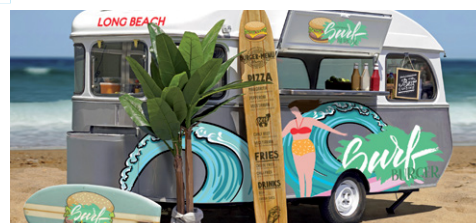
MARQUAGE DES VEHICULES

©Copyright 2018 HP Development Company, L.P. Les informations contenues dans ce document sont sujettes à changement sans préavis.