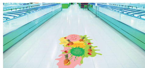
GRAPHISMES POUR SOLS