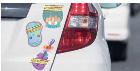
ETIQUETTES ET AUTOCOLLANTS