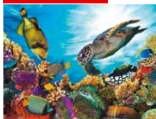
Position correcte de dépôt des gouttelettes et alimentation papier adaptée pour une qualité d'impression optimale