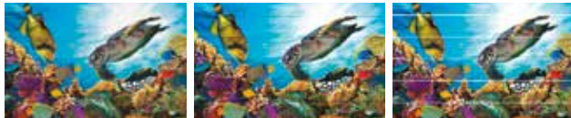
Position incorrecte de dépôt bidirectionnel des gouttelettes

* La fonction DAS peut ne pas être compatible avec certains supports tels que les supports colorés, transparents et gaufrés.