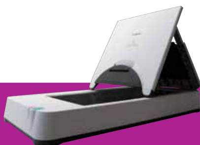
Glace d'exposition A4 Flatbed 201

Bénéficiez d'une qualité d'image irréprochable avec Kofax VRS. La numérisation devient plus simple grâce à sa capacité de traitement d'image et de gestion automatique des documents. La qualité d'image obtenue, inégalable sur le marché, améliore la lisibilité et augmente la capacité de reconnaissance optique de caractères (OCR).