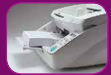
Position basse (500 feuilles)