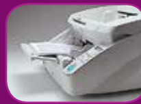
Position haute (100 feuilles)

Le chargeur de documents dispose de trois modes sélectionnables (100, 300 et 500 feuilles) qui permettent de s'adapter au volume des lots à numériser, afin de gagner du temps et d'améliorer le rendement.