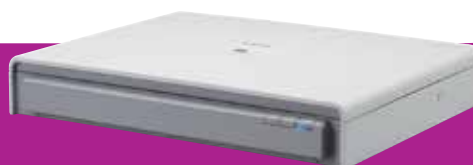
Glace d'exposition A3 Flatbed 201