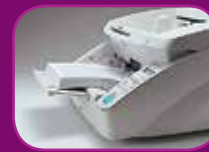
Position intermédiaire (300 feuilles)