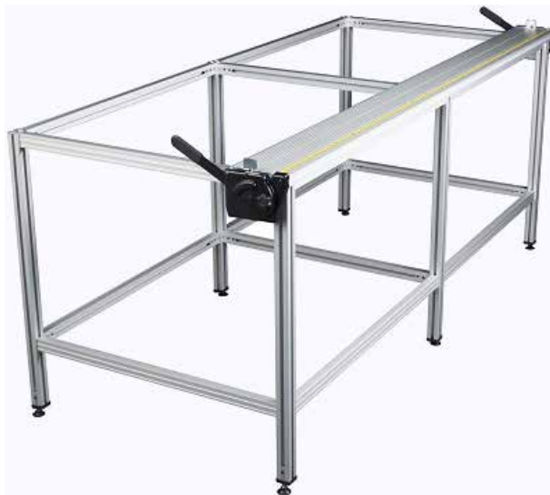
▲ Big Bench Xtra